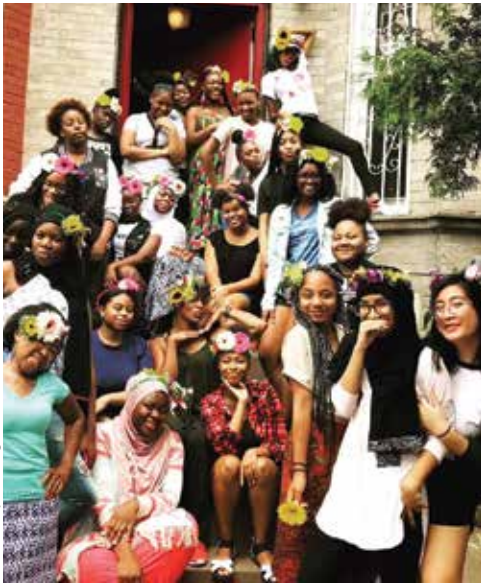
Plan de Mujeres Negras

Una Gran Hora de Compartir es la forma única y más grande en que el pueblo presbiteriano se reúne cada año para trabajar por un mundo mejor.